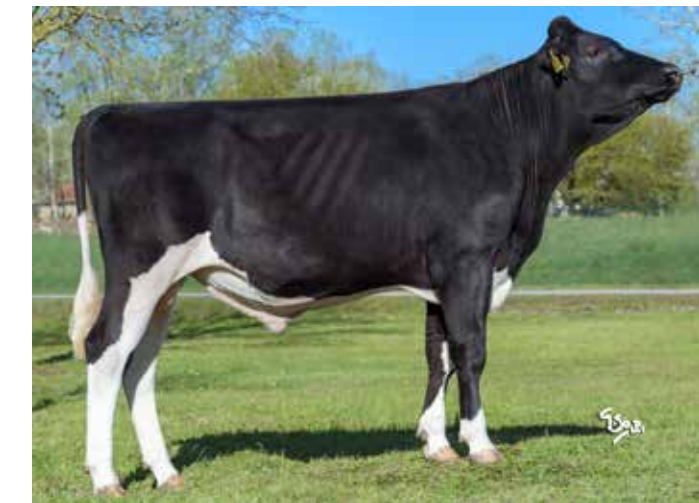
Onze nieuwste aanwinst Smoothie (aAa 516 Bahrain x Topgear x Malcolm) is A2/A2 en BB. Voor meer informatie: zie de stierenkaart.

Hét boegbeeld uit de testprogramma’s is evenwel Weggelhorst Disclosure (aAa 516). Hij is de hoogste stier voor aanhoudingscijfers in de 156-groep en toont zich een fenomeen qua gezondheid. Dat we vertrouwen hebben in onze stieren wordt onderstreept door het feit dat we van Disclosure dochter Koosje 42 (Ex-90) een roodbonte Potter P zoon beschikbaar hebben, namelijk: FaWi Murtang Red P (aAa 561). Daarnaast hebben we met Visstein Armando (aAa 165) de eerste Frassino-zoon in ons pakket. Van hem zijn de eerste beloftevolle kalveren reeds geboren. Andere stieren die veel tevreden gebruikers hebben zijn Topspeed Raglan (aAa 561), FaWi Allegro, FaWi Futuro (beide 516). Bovenstaande resultaten sterken ons in de mening dat we op de goede weg zijn en geeft ons vertrouwen in de toekomst. Zo verwachten we veel van Poppe Ponale (aAa 156), Veecom Mischa RF (aAa 156) en Double W Rimini (aAa 516). We hopen u van dienst te kunnen blijven. Informeert u gerust naar onze jonge stieren.