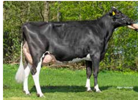
Caruso dochter Akke 147

Topspeed Raglan heeft een bijzondere sta-