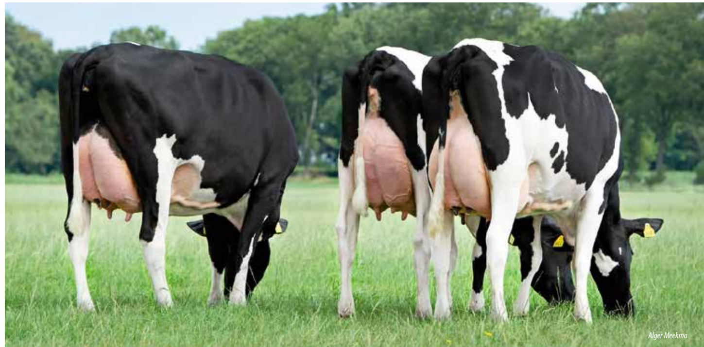
Ginstream dochters, Melkveebedrijf Batenburg, Giethoorn

Onze klanten zijn erg enthousiast over Ginstream dochters. We krijgen regelmatig filmpjes onder ogen van beste Ginstream dochters en de producties die daarbij vermeld worden, zijn zeer aansprekend.