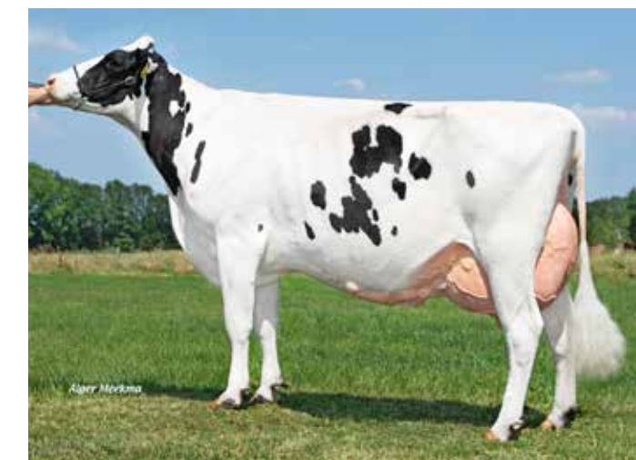
Disclosure dochter Koosje 42 (Ex-90), Mts Wieggers, Marienvelde

Hét boegbeeld uit de testprogramma’s is evenwel Weggelhorst Disclosure (aAa 516). Hij is de hoogste stier voor aanhoudingscijfers in de 156-groep en toont zich een fenomeen qua gezondheid. Dat we vertrouwen hebben in onze stieren wordt onderstreept door het feit dat we van Disclosure dochter Koosje 42 (Ex-90) een roodbonte Potter P zoon beschikbaar hebben, namelijk: FaWi Murtang Red P (aAa 561). Daarnaast hebben we met Visstein Armando (aAa 165) de eerste Frassino-zoon in ons pakket. Van hem zijn de eerste beloftevolle kalveren reeds geboren. Andere stieren die veel tevreden gebruikers hebben zijn Topspeed Raglan (aAa 561), FaWi Allegro, FaWi Futuro (beide 516). Bovenstaande resultaten sterken ons in de mening dat we op de goede weg zijn en geeft ons vertrouwen in de toekomst. Zo verwachten we veel van Poppe Ponale (aAa 156), Veecom Mischa RF (aAa 156) en Double W Rimini (aAa 516). We hopen u van dienst te kunnen blijven. Informeert u gerust naar onze jonge stieren.