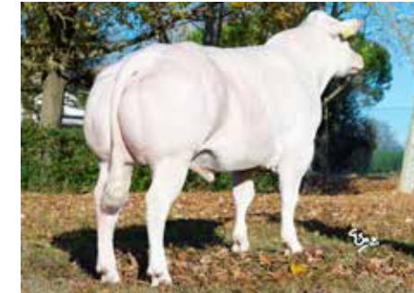
Topstier in BWB: Expression van de Plashoeve

vlag en wimpel geslaagd na de testperiode. D'Aubremee is jarenlang één van de beste BWB stieren van Nederland en Italië. Het is fantastisch dat we met Eusebio en Eiffel twee van zijn zonen beschikbaar hebben. We denken dat zowel draagtijd als geboortegemak zeer gunstig zullen uitvallen.