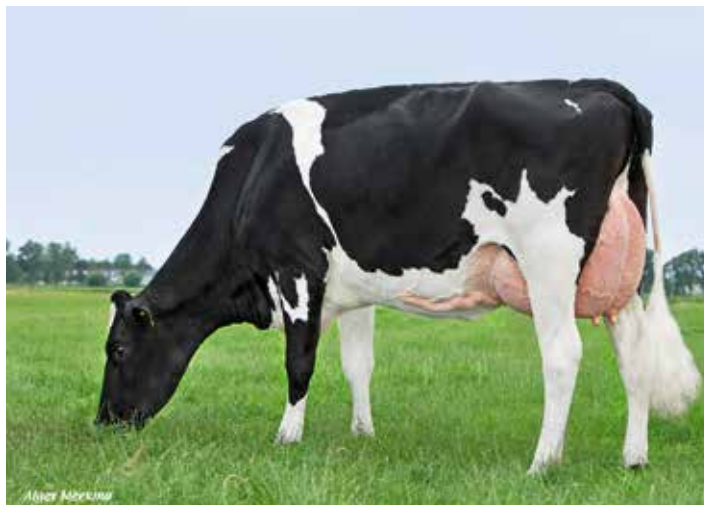
Raglan dochter Maartje 445

veel persistenter is geworden. Dit zie ik ook terug in m’n MPR, de oud melkse koeien doen het met een BSK van 59 beter dan mijn verse koeien en eigenlijk zie ik dat ook veel liever. Ik zie het liefst een vlakke lactatiecurve. Verse koeien hoeven geen 60kg te geven Oudere koeien geven gewoon meer melk dan een vaars. Om dat te kunnen bereiken wil je die extremen vermijden en dit geeft ook meer arbeidsplezier. Door hun bouw staan ze vierkant op hun poten met, gedurende de lactatie, behoud van conditie.” “We fokken niet perse op uiers, juist te strakke ophangbanden geven meer problemen, uiers moeten functioneel zijn. Daarnaast zitten we altijd onder de 100 celgetal. Doordat de veestapel ouder wordt verkopen we structureel verse vaarzen. De aanwezige koeien hebben 35.500kg melk gegeven en de levensproductie bij afvoer is 51.500kg gemiddeld over de laatste 3 jaar. Rick adviseert gewoon de fokstieren die het beste bij onze koeien passen. Het maakt dus ook niet uit welke organisatie deze stier heeft. Op dit moment melken we goede koeien van: Torrer, Kodak, Madiba, Malki, Potter P, Raglan en Fez. Daarnaast insemineren we nu met: Rody Red, Raglan, Rubicon, Rimini, Miura, Big Deal, Andy Red en Caruso. Stieren die passen blijven we ook gebruiken. Zo hebben we koeien, pinken en insemineren we nog met Raglan. Een goede stier blijft gewoon een goede stier.”